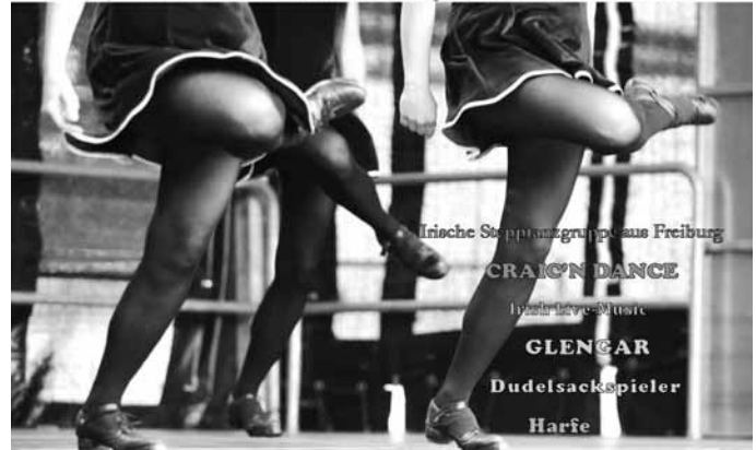
Irische Stepptanzgruppe aus Freiburg