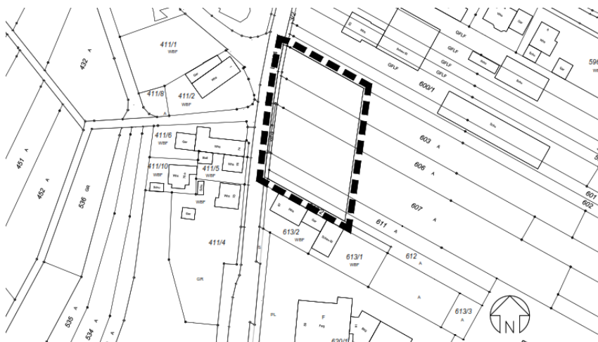
Geltungsbereich des Bebauungsplans auf Grundlage des amtlichen Liegenschaftskatasters (ohne Maßstab)

Das Plangebiet (rd. 0,2 ha) befindet sich an der Hauptstraße (L 104) in Niederhausen und wird derzeit landwirtschaftlich genutzt. Nördlich des Plangebiets befinden sich Teile einer erkennbar aufgegebenen landwirtschaftlichen Hofstelle und ein erkennbar derzeit nicht bewohntes Wohnhaus. Die Flächen östlich des Plangebiets werden landwirtschaftlich genutzt und im Süden befindet sich ein Wohngebäude. Im Westen wird das Plangebiet von der Hauptstraße begrenzt. Die genaue Abgrenzung ist dem nachfolgenden Plan zu entnehmen.