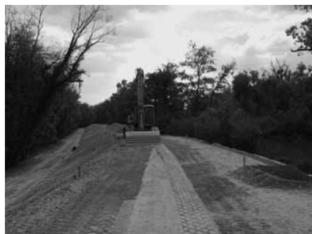
Sanierungsabschnitt des Rheinhochwasser-damms IV