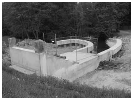
Einlauf des Mühlbachdükers am Leopoldskanal – hier ist der Treffpunkt zum Tag der offenen Baustelle