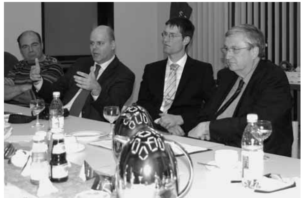
Bürgermeister Dr. Jürgen Louis im Gespräch mit dem Regierungspräsidenten Würtenberger über die herausragende Stellung der Wiesenwässerung für die Kultur- und Naturlandschaft und die Trinkwasserversorgung der Gemeinden

Um die Aufgaben des Wasserverbandes auch in Zukunft zu sichern, wurde aus den Reihen des Wasserverbandes die Gründung eines gemeinnützigen Vereins zur Förderung des Naturschutzgebietes Elzwiesen vorgeschlagen. Regierungspräsident Würtenberger signalisierte die Unterstützung des Regierungspräsidiums Freiburg für die Errichtung eines Fördervereins und ermutigte die anwesenden Behörden- und Firmenvertreter dieses Ansinnen tatkräftig zu unterstützen.