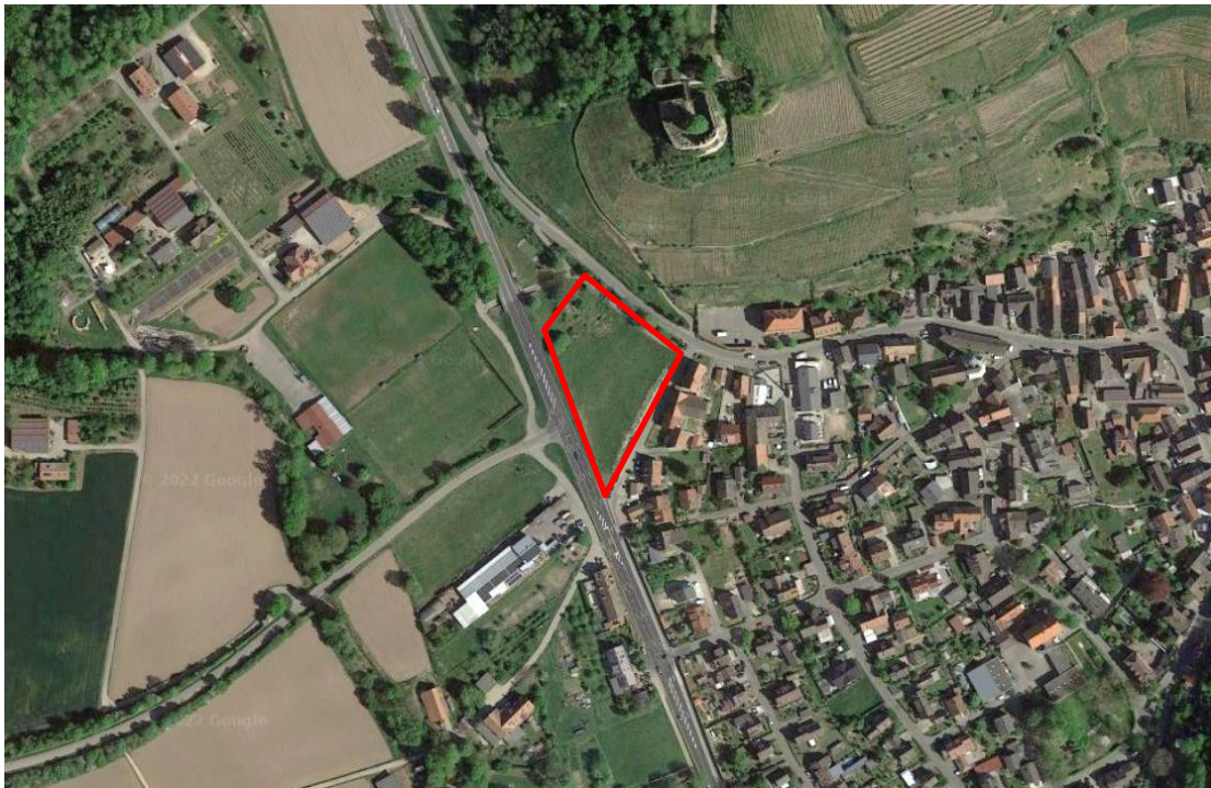
Lage des Änderungsbereichs im Luftbild (schematische Darstellung)