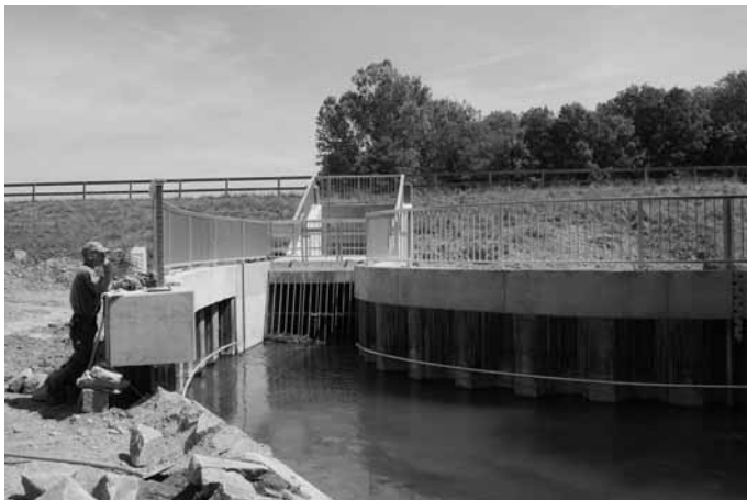
Die automatische Warnanlage am Mühlbachdüker soll mehr Schutz im Hochwasserfall bieten.

Im Rahmen des Planfeststellungsverfahrens zum Hochwasserschutz Rheinhausen hatten die Gemeinden Rheinhausen und Weisweil einen verbesserten Hochwasserschutz am Mühlbachdüker gefordert. Um den geforderten Schutz auch tatsächlich zu erhalten, hatten beide Gemeinden das Land Baden-Württemberg im Jahr 2006 vor dem Verwaltungsgericht Freiburg verklagt. In einer außergerichtlichen Einigung hatte das Land Baden-Württemberg schließlich zugesichert, dass mehrere Messstellen am Mühlbach sowie eine automatische Warnanlage am Einlauf des Mühlbachdükers eingerichtet werden. Die automatische Warnanlage verfügt über ein GSM-Modul, das bei Erreichen eines Meldewasserstandes von 166,75 m+NN eine Meldung an die Gemeinde Rheinhausen und an das Land Baden-Württemberg absetzt. Zudem hat sich das Land Baden-Württemberg verpflichtet, mehrere Grundwassermessstellen mit Datenloggern auszustatten, um die Grundwasserstände kontinuierlich kontrollieren zu können.