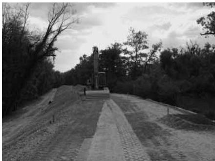
Sanierungsabschnitt des Rheinhochwasersedamms IV