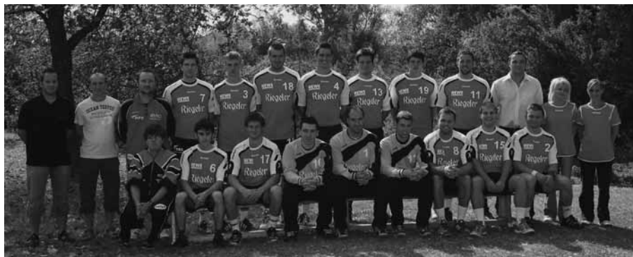
TuS Mannschaft 09/10

Nach einer langen Vorbereitung beginnt am kommenden Sonntag, 20.9. für die TuS-Handballer die Hallenhandball-Saison 2009/2010. Zum ersten Saisonspiel erwartet das neuformierte TuS-Team den TV Brombach in der Rheinmatthalle. Spielbeginn ist um 16:30 Uhr.