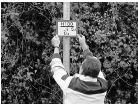
Montage eines Hinweisschildes an einem Masten einer in der Nähe stehenden Straßenlampe

Leider müssen wir immer wieder feststellen, dass solche Tafeln durch bauliche Veränderungen an Gebäuden, Zäunen, Mauern usw. entfernt und nicht wieder angebracht werden. Eine sehr große Hilfe für uns wäre auch, dass von Grundstückseigentümern Hecken und Büsche zurückgeschnitten werden, damit diese Schilder nicht verdeckt werden. Auch bei baulichen Veränderungen bitten wie Sie, uns dies mitzuteilen. So können die Schilder an andere Stelle montiert werden können.