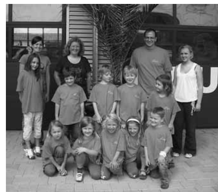
Pressestelle Musikverein Oberhausen

tränke beim Musikzentrum und natürlich für jeden Teilnehmer einen „Pokal“.