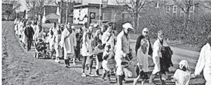
Nach Ankunft am Bürgerhaus zeigten die Kinder ihren Bobfahrertanz.