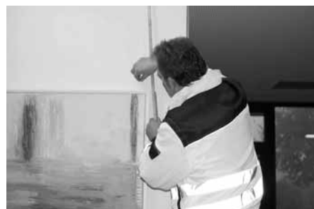
Montage einer speziellen Führungsschiene, die zum Aufhängen von Bildern dient.

Einiges zu Tun gab es in den vergangenen Tagen im Bürgerhaus. Anlässlich der großen Kunstausstellung wurde im Konzert- und Festsaal, im Foyer und in der Galerie über 50 Werke aufgebaut. Nach den Vorgaben des Organisators wurden Skulpturen auf speziellen Podesten in Position gebracht. Verschiedene Gemälde wurden im Obergeschoss und an den Wänden des Konzert- und Festsaales professionell angebracht. Im Großen und Ganzen war dies für die Bauhofmitarbeiter eine sehr verantwortungsvolle und behutsame Aufgabe, die mit sehr viel Sorgfalt von den Bauhofmitarbeitern und des Hausmeisters bewältigt wurde.