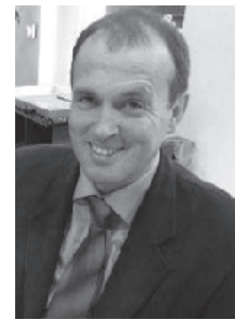
Pfr. Rüdiger Schulze

Am Sonntag, 21. September 2014, um 15 Uhr in der Evangelischen Stadtkirche Emmendingen wird Dekan Rüdiger Schulze in sein Amt eingeführt.