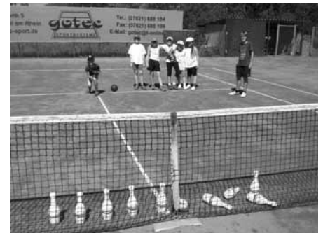
Das Bild zeigt einen Teil der Kinder bei einer Station