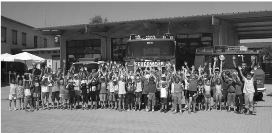
Weitere Bilder der Aktionen stehen bereits auf der Internetseite www.ffw-rheinhausen.de .