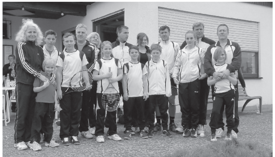
Das Bild zeigt die teilnehmenden Mannschaften

Bereits am ersten Maiwochenende beginnen die Medenspiele und man war froh, dass man sich vor den Wettkämpfen etwas auf dem roten Sand vorbereiten konnte.