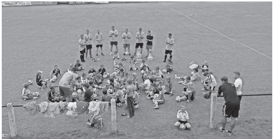
Jugendarbeit bei der SG-Rheinhausen