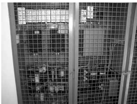
und die 50 Jahre alte Steuerungseinheit.

Nach dem Austausch sämtlicher Rohrleitungen im Wasserwerk, wurde in diesen Tagen die gesamte Schaltanlage erneuert. Bereits 2006 wurde die elektrische Anlage bei einer Abnahme beanstandet. In den letzten Jahren war die Anlage sehr störanfällig und wurde immer provisorisch von den Verantwortlichen repariert um die Wasserversorgung aufrecht zu erhalten.