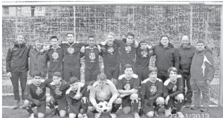
B-Jugend: SG Herbolzheim/Rheinhausen – FC Simonswald

Durch eine beeindruckende Leistung in der 2. Halbzeit und einer großen Moral des gesamten Teams, konnte die B-Jugend am vergangenen Wochenende noch einen Punkt vom Kunstrasen in Simonswald entführen. Nach einem unglücklichen 0:3 Rückstand konnte sich das Team wieder auf 2:3 heran kämpfen. Das folgende 2:4 10 Min. vor Spielende schien dann aber für viele Zuschauer die Vorentscheidung zu sein. Mit 2 Toren in den letzten 5 Min wurde noch ein 4:4. Insgesamt blickt die Mannschaft auf eine sehr erfolgreiche Hinrunde zurück.