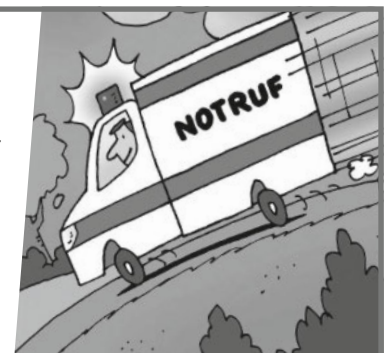
Illustration: © Dieter Hermenau