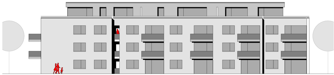
Schematische Ansicht Gartenseite Baukörper 5 (Quelle: Projektbau Freiburg GmbH, Stand Mai 2022 | ohne Maßstab)

Hinsichtlich des mit der Nachnutzung des Geländes zu erwartenden Verkehrsaufkommens ist davon auszugehen, dass die Verkehrsbelastung für die Neubebauung im Vergleich zum Schulbetrieb keine maßgeblichen Unterschiede aufweisen wird. Tendenziell wird sich die Verkehrsbelastung im Tagesverlauf, u. a. durch den Wegfall der Belastung durch Schulbusse, sogar eher entzerren. Auch kann die vorhandene Verkehrsinfrastruktur den zu erwartenden Verkehr ohne Einschränkungen aufnehmen. Die Schulstraße weist eine Breite von ca. 6,50 m auf, sodass ein Begegnungsfall LKW/LKW möglich ist, ohne auf Seitenbereiche ausweichen zu müssen. Abschnittsweise wird hier auch seitlich geparkt. Ein Gehweg ist beidseitig vorhanden.