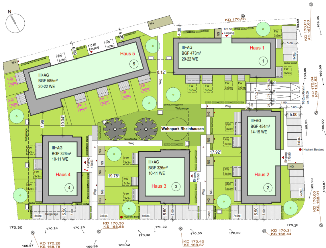
Lageplan (Quelle: Projektbau Freiburg GmbH, Stand Mai 2022 | ohne Maßstab)

Der nachfolgende Lageplan stellt die Grundlage für den in die Planzeichnung integrierten Vorhaben- und Erschließungsplan dar und ist, wie die ebenfalls nachfolgenden schematischen Ansichten, Bestandteil des Durchführungsvertrags.