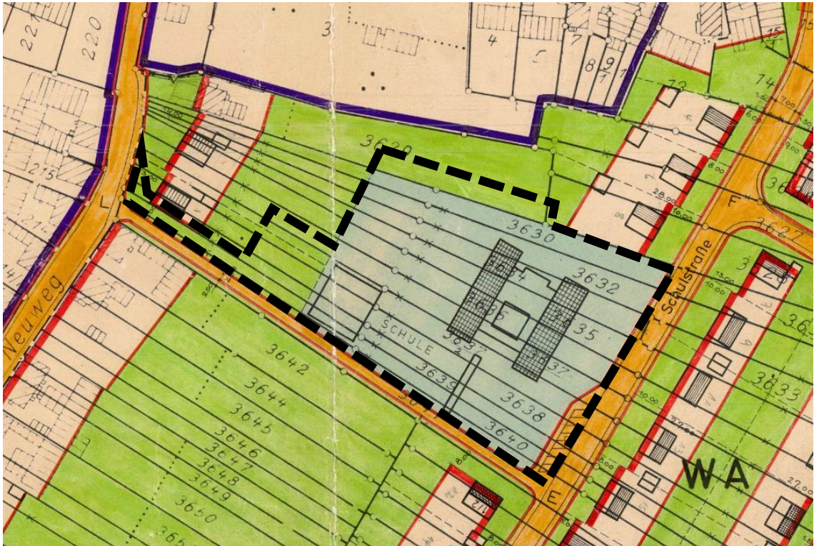
Ausschnitt aus dem Bebauungsplan „Maiergärten, Oberdorf, Kirchenfeld und Untere Sände“ mit Geltungsbereich (schwarz gestrichelt) des vorhabenbezogenen Bebauungsplans „Altes Schulareal“ (ohne Maßstab)