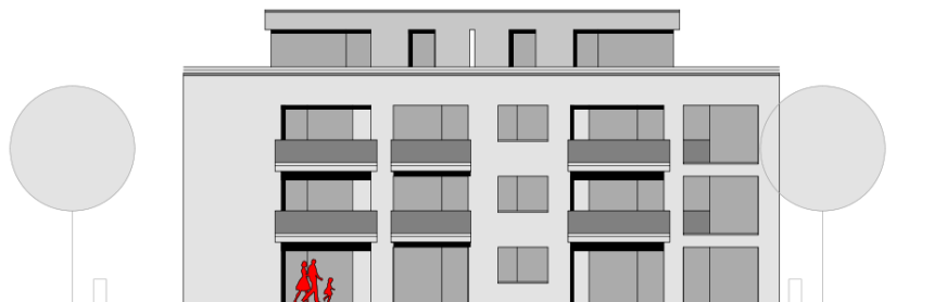
Schematische Ansicht Gartenseite Baukörper 4 (Quelle: Projektbau Freiburg GmbH, Stand Mai 2022 | ohne Maßstab)