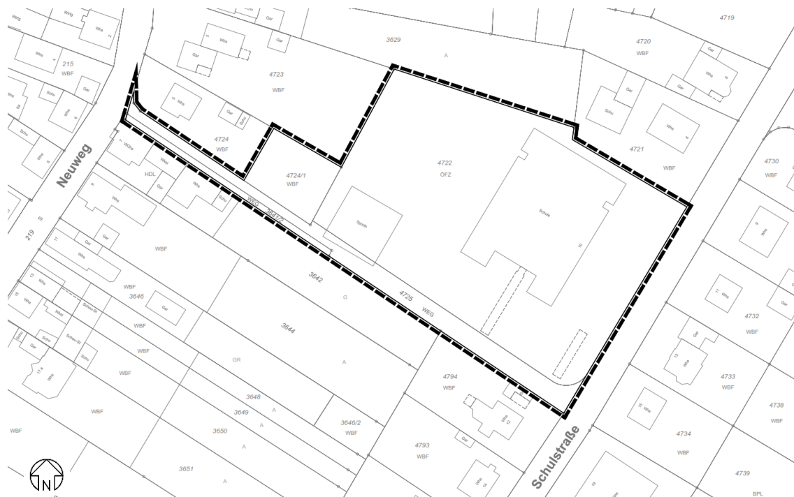
Geltungsbereich des Bebauungsplans auf Grundlage des amtlichen Liegenschaftskatasters (ohne Maßstab)