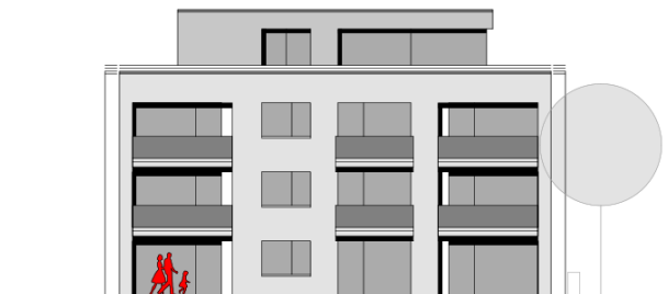
Schematische Ansicht Gartenseite Baukörper 3 (Quelle: Projektbau Freiburg GmbH, Stand Mai 2022 | ohne Maßstab)