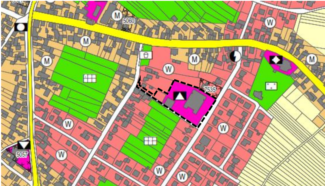
Ausschnitt aus dem Flächennutzungsplan Kenzingen – Herbolzheim – Rheinhausen – Weisweil von 2018 mit ungefähre Abgrenzung des Plangebiets (ohne Maßstab)

Da es sich im vorliegenden Fall um einen Bebauungsplan handelt, der im beschleunigten Verfahren gemäß § 13a BauGB aufgestellt wird, kann der Bebauungsplan von den Darstellungen des Flächennutzungsplans abweichen, wenn die geordnete städtebauliche Entwicklung der Gemeinde dadurch nicht beeinträchtigt wird. Dies ist nicht der Fall, da die bereits bestehende Wohnbebauung baulich ergänzt wird. Der Flächennutzungsplan wird im Sinne der Berichtigung nach § 13a (2) Satz 2 BauGB nach Abschluss des Bebauungsplanverfahrens berichtigt.