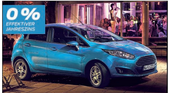
Abbildung zeigt Wunschausstattung gegen Mehrpreis.

Freitag: Steakabend mit Heizraum Samstag: bayrischer Abend mit den Ruster Musikanten Sonntag: Frühschoppen mit den fidelen Forchheimern & Wagenstadter Bulldoggtreffen im großen Festzelt