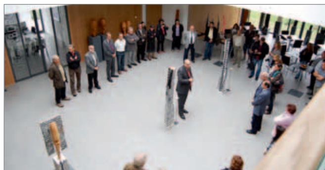
Begrüßung im Foyer des Bürgerhauses.

Am vergangenen Sonntag waren Wittisheims Gemeinderäte zu Gast in Rheinhausen. Für den jährlichen Ausflug des Gemeinderates hatten sich unsere elsässischen Freunde in diesem Jahr ihre deutsche Partnergemeinde ausgewählt. Zwar fiel die ursprünglich geplante Bootsfahrt durch den Taubergießen der Witterung zum Opfer. Die elsässischen Gäste wurden jedoch entschädigt durch ein mehrstündiges Mittagessen, mit dem man sich für die anschließende Einweihung des Wittisheimer Platzes stärkte.