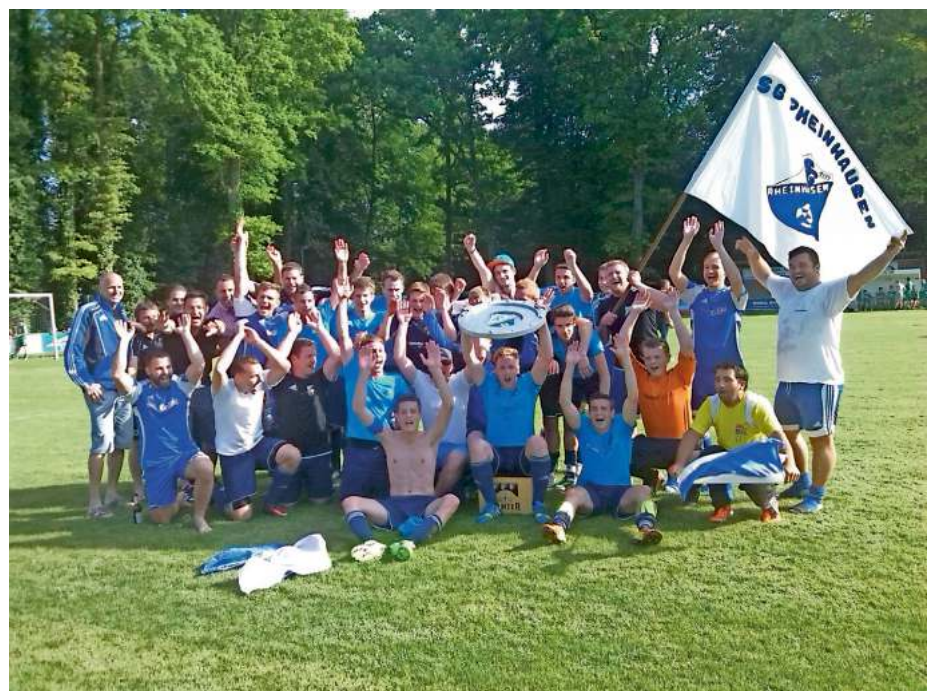
Die Meistermannschaft der SG Rheinhausen in der Saison 2013/14

Die Gemeinde freut sich mit der SG Rheinhausen über den Gewinn der Meisterschaft und gratuliert dem Trainer, den Spielern, Helfern und Fans sehr herzlich zum Aufstieg. Für die nächste Saisonwünschen wir der SG Rheinhausen weiterhin viel Erfolg und viele spannende Spiele.