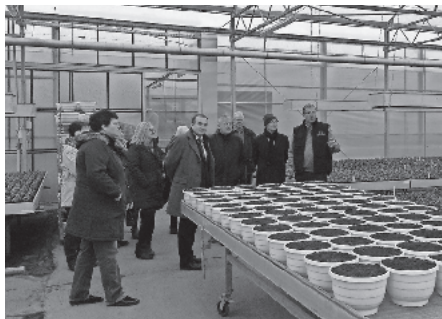
Betriebsbesichtigung bei der Gärtnerei Hans Lösslin